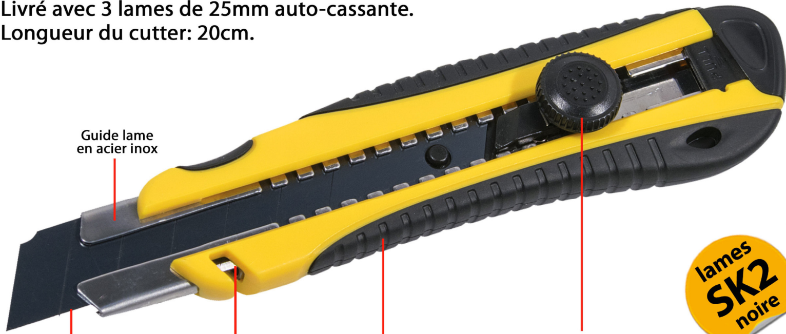
Guide lame en acier inox