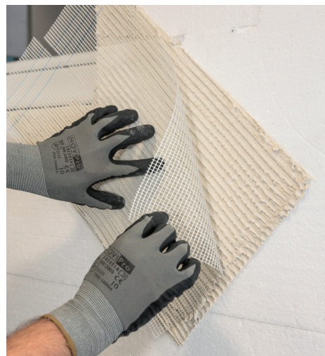
Réalisation d'un renfort d'angle en partie courante.