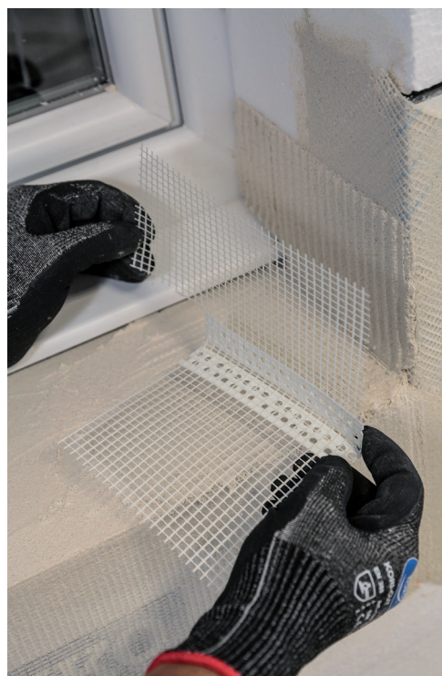
Réalisation d'un renfort appui-tableau.